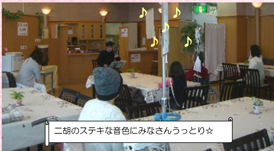
二胡のステキな音色にみなさんうっとり☆

第2回目の「 やすらぎティータイム 」を2月4日に開催しました。このティータイムは、患者さん、家族の方へ病院の中でやすらげる時間と場所を提供することを目的としたものです。今回は、患者さん4人、ご家族5人、スタッフ7人、