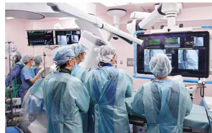
循環器内科医による弁留置

されたハートチームが治療方針の検討から手術の実施、術前から術後の患者さんの管理にあたっていきます。手術の施設基準や手術の難易度などからハイブリッド手術室