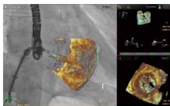
透視と心エコーの組み合わせ

このたび、ハイブリッド手術室の更新時期となり、令和7年8月～9月の2か月間、一旦手術を休止して更新工事を行いました。新しい最新の医療機器の揃ったハイブリッド手術室に生まれ変わり、10月より治療を再開しております。新しい手術室は、これまでよりもやや広く、機器の操作や移動がしやすく、手術スタッフがより快適に手術を行うことができる環境が整備されました。同時に、透視や心エコーの機器の基本的性能の向上、機器間の連携の充実により透視画像にCTや心エコーの画像を組み合わせた表示が可能になるなど、手術中の画像の質向上が図ら