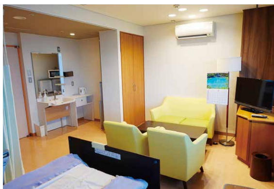
【参考】5階西病棟特別室