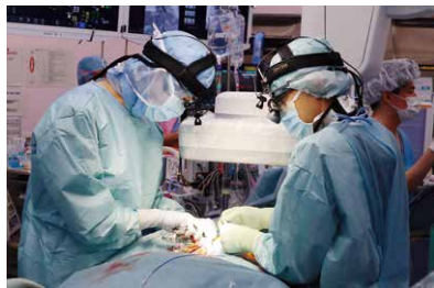
心臓血管外科医による血管処置

がないと実施が困難な手術も多く、最先端の循環器治療を提供するために必要不可欠な設備となっております。患者さんにとっては、より少ない負担で、安全で高度な手術を受けていただけるメリットが