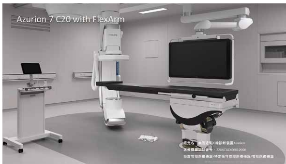
ハイブリッド手術室と血管造影装置

ハイブリッド手術室とは、血管造影装置を有する手術室で、「手術室」と「カテーテル室」が組み合わさった高度な機能を有する手術室のことです。山形県内では山形大学医学部附属病院、山形県立中央病院、および当院に設置され、心臓血管手術を中心に様々な治療が行われています。