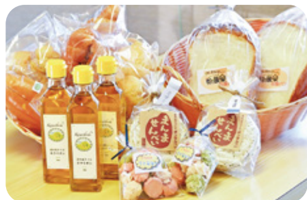
2 はんどめいと糸蔵楽 様