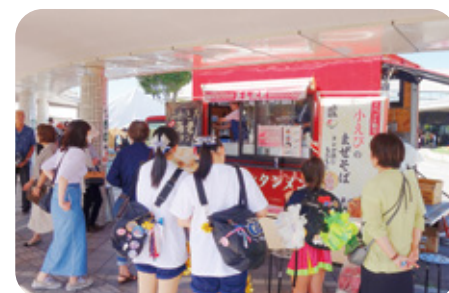
8 酒田ラーメン 花鳥風月 様