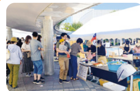
9 台湾料理 如意 様