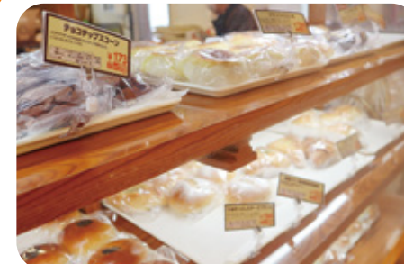
15 カフェ・コア 様