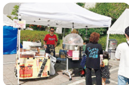
7 浪漫非行 様