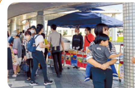
12 たぶの木 様