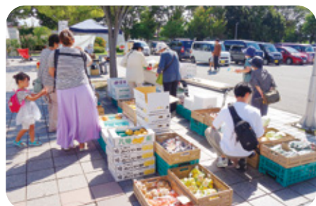
3 やさいろ 様