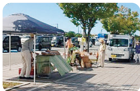
5 SunLips×gira e gira 様