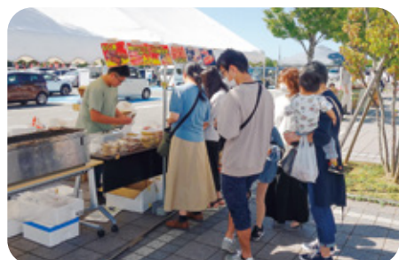
4 焼きそば専門店 テンテン 様