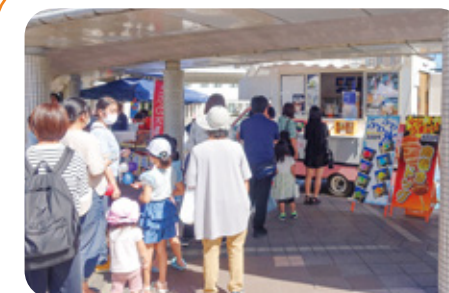
11 月山アイスクリーム 様