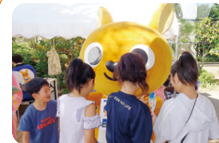
14 かんぽ生命 様