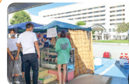
10 すまいるらんど 様