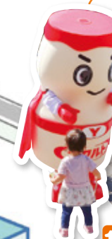
13 庄内ヤクルト販売株式会社 様