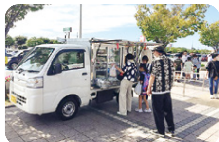
6 無印良品 様