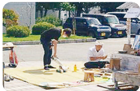
1 アトリエイマジン 様